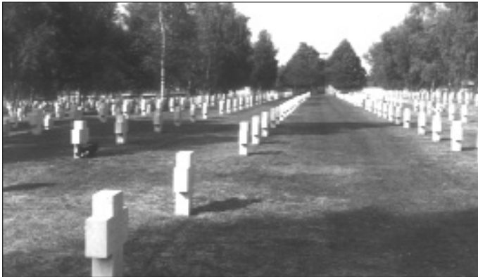
Das Foto zeigt den deutschen Soldatenfriedhof Bourdon in Frankreich. Auf diesem Friedhof ruht ein Bürger von Kippenheim.

Bitte helfen Sie dem Volksbund mit Ihrer Spende bei der Anlage und Pflege der Kriegsgräberstätten sowie beim Ausbau der Jugendarbeit. Sie tragen mit Ihrem Beitrag zum Frieden in der Welt bei.