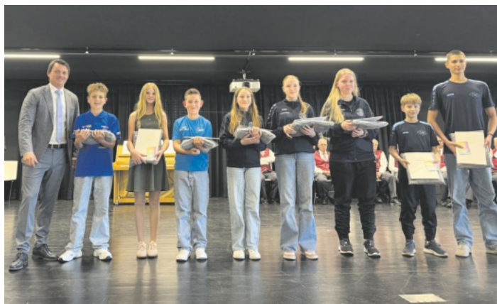
Ehrung der Sportler: Kinder und Jugendliche

Einen großen Raum nahmen zudem die Sportlerehrungen ein. Ausgezeichnet wurden Kinder, Jugendliche und Erwachsene für herausragende Erfolge bei Kreis-, Landes- und Meisterschaftswettbewerben in unterschiedlichen Sportarten. Besonders erfreulich war die Vielzahl an Erfolgen von Kindern und Jugendlichen in unterschiedlichsten Bereichen: Schießsport, Schwimmen, Motorsport, Reitsport und Pétanque. Die Gemeinde würdigte die sportlichen Leistungen ebenso wie den Trainingsfleiß und die Disziplin der Geehrten.