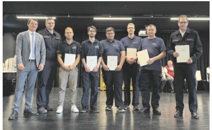
Ehrung der Rettungskräfte

Im Anschluss wurden Mitglieder der Feuerwehren aus Kippenheim und Mahlberg für das erfolgreiche Ablegen des Feuerwehr-Leistungsabzeichens in Bronze ausgezeichnet. Die Gemeinde würdigt damit den wichtigen ehrenamtlichen Einsatz der Feuerwehrkameraden für die Sicherheit der Bevölkerung.