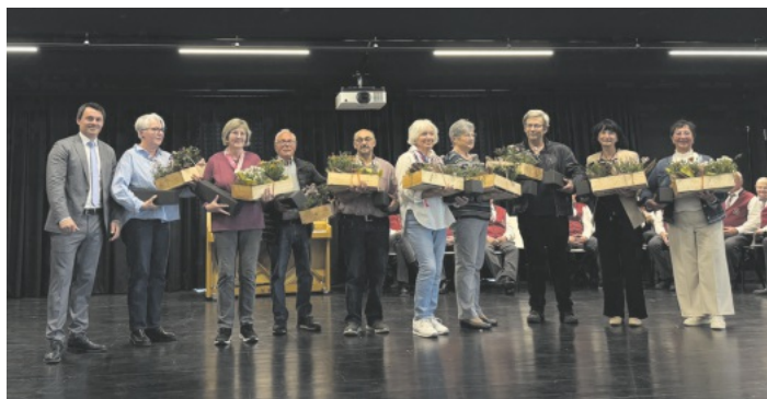
Ehrung der Grünpaten

Auch musikalische Leistungen wurden gewürdigt. Mehrere junge Musikerinnen und Musiker erhielten Ehrungen für erfolgreich abgelegte Jungmusiker-Leistungsabzeichen in Bronze und Silber. Bürgermeister Gutbrod gratulierte den Nachwuchsmusikerinnen und -musikern zu ihren hervorragenden Leistungen und ihrem Engagement im örtlichen Musikverein.