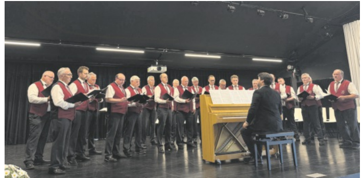
MGV Liederkrans Kippenheim e.V. 1896

Musikalisch begleitet wurde der Abend durch mehrere Gesangsbeiträge des MGV, die für einen feierlichen und würdigen Rahmen sorgten.