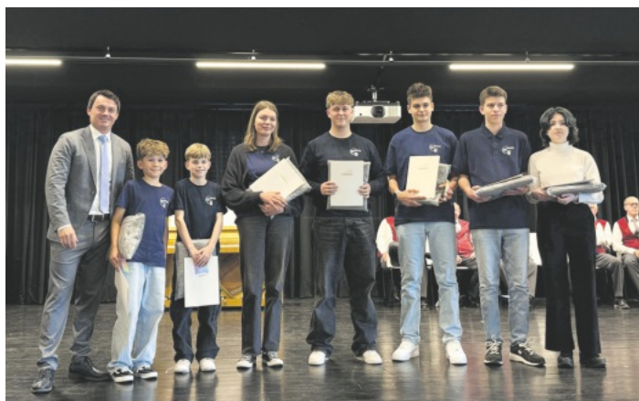
Ehrung der Jungmusiker