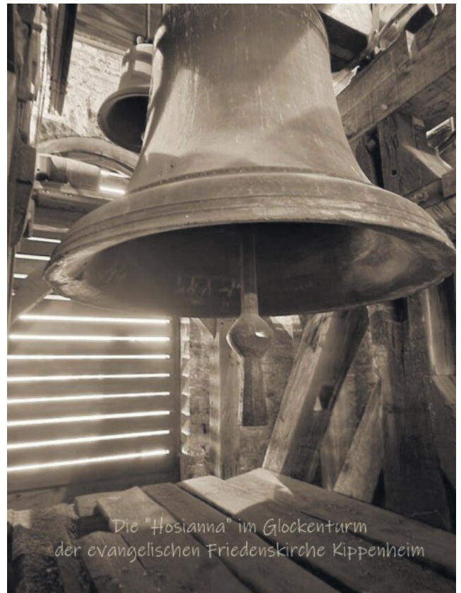
Die "Hosianna" im Glockenturm der evangelischen Friedenskirche Kippenheim

In der Friedenskirche (ev. Kirche) hängt die älteste Glocke, „Hosianna“. Sie wurde 1517 von einem Glockengießer aus Straßburg hergestellt. Die Geläute der katholischen und evangelischen Kirche ergänzen sich und passen zueinander. Die Kapelle „Maria Frieden“ besitzt drei Glocken, die heute noch von Hand geläutet werden. Sie sind Maria, Josef und Johannes geweiht. Immer wieder mussten in Kriegszeiten Glocken abgegeben werden, weil man sie zu Kanonenkugeln einschmelzen wollte.